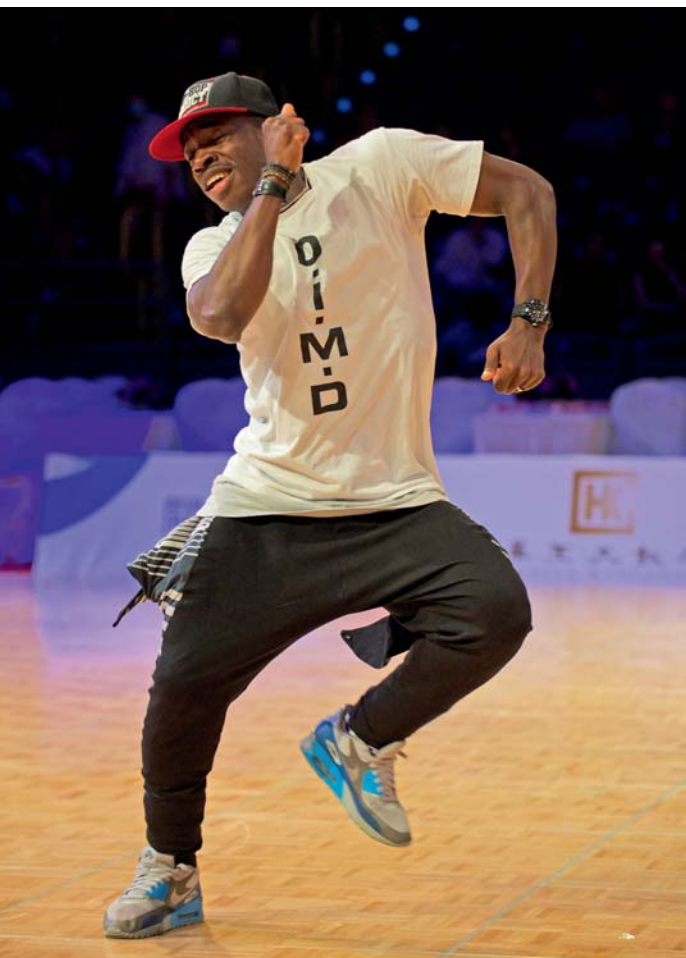
Der ehemalige Hip-Hop-Weltmeister Dinipiri Etebu gewinnt in Kaohsiung.