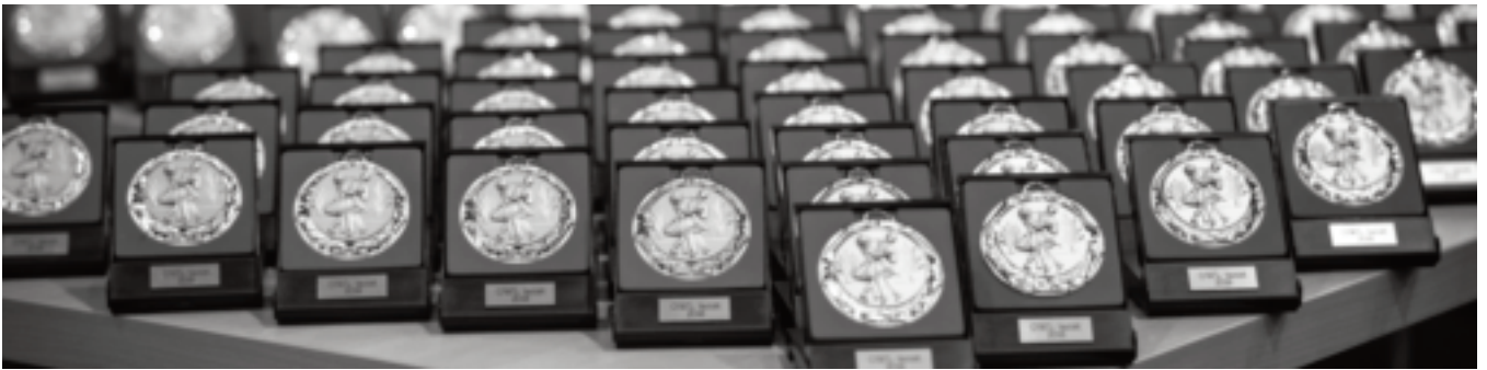
Siegermedaille 2018

Mehr als 100 Helfer aus fünf Vereinen sorgten dafür, dass an zwei Tagen 77 Turniere auf fünf Flächen stattfanden. Über 1000 Meldungen waren im Vorfeld eingegangen. Paare aus ganz Deutschland kamen auch in diesem Jahr am zweiten Wochenende im November wieder nach Bielefeld, um sich miteinander zu messen. Für die Helfer begann das Veranstaltungswochenende bereits am Freitag um 15 Uhr. 2.800 m 2 Schutzboden und Parkett mussten verlegt werden, um die Seidensticker Halle in einen Tanzsaal mit fünf Flächen zu verwandeln.