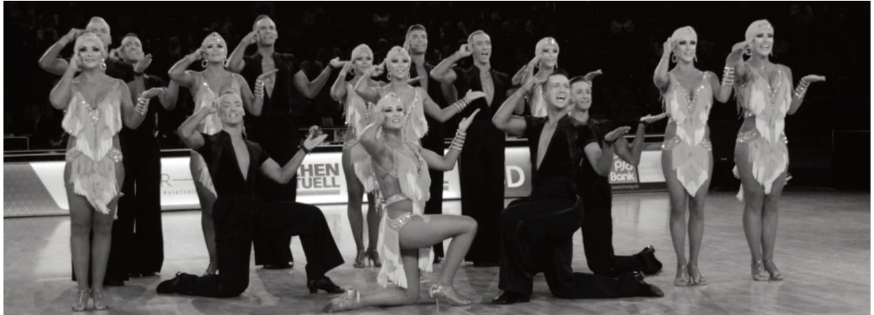
1. TSZ Velbert

In der Braunschweiger Volkswagenhalle ertanzten sich die Lateintänzer der Formation vom 1. TSZ Velbert in einem spannenden Finale den Titel des Vizemeisters der diesjährigen Deutschen Meisterschaft mit einem Punkteabstand von nur 0,792 zum erstplatzierten Team aus Bremen. Die Aufsteiger der Formationsgemeinschaft des TSZ Aachen/Boston Club Düsseldorf verpassten den Einzug in das Finale und erreichten Platz fünf. In der Standardsektion wurde das Team vom Boston Club Düsseldorf Siebte.