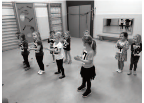
Abnahme des Tanzsternchens

Warum machen wir das? Können die Kinder nicht nachmittags zu einem regulären Vereinsangebot? Zum einen sind unsere räumlichen Verhältnisse beschränkt. Wir nutzen die städt. Sporthallen, die weitestgehend und insbesondere zu „kinderfreundlichen“ Zeiten ausgelastet sind. Zum anderen denken wir an die Kinder, die nach der Kita durch verschiedenste Gründe nicht zu einem Vereinsangebot gebracht werden können – (z.B. Alleinerziehende mit mehreren Kindern, Kinderbetreuung durch Großeltern, die nur bedingt „transportieren“ etc.)