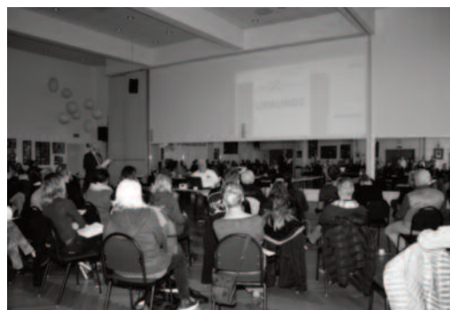
Änderungen beim DTSA

Es war ein gelungener Lehrgang, bei dem das Team der VTG Grün Gold Recklinghausen die vorzüglichen Rahmenbedingungen bot. Text: Renate Spantig