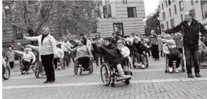
Flashmob Münster City

Das Pendant zu den Turnierpaaren ohne Handicap sind die Rollstuhltanzpaare der Leistungsklasse oder High Class. Duo- und Kombipaare tanzen hier die fünf Standard- oder Lateinamerikanischen Tänze. Die Klassifizierung in LWD 1 (Level Wheelchair Dancing) und LWD 2 berücksichtigt das individuelle Handicap.