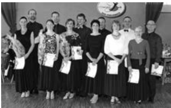
Senioren I D beim TSC Crucenia – nach Platz und Größe sortiert (die Sieger stehen links).