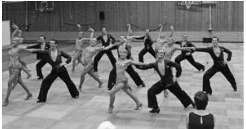
Am Ende Jubel über den Heimsieg: TSG Backnang.

Platz zwei im Turnier, aber Aufstieg als Tabellenerster: 1. TC Ludwigsburg.