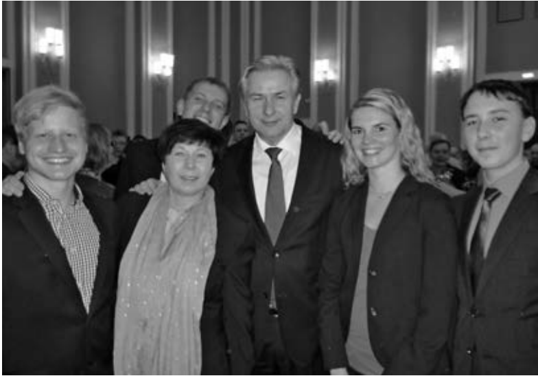
Fotoshooting mit dem Regierenden Bürgermeister.