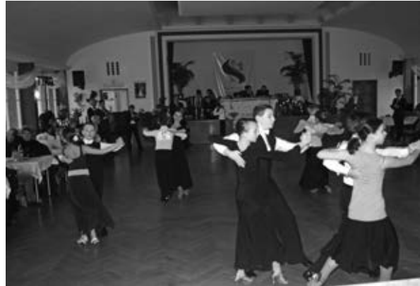
Junioren D in Standard-Aktion.

Beim offenen Discofox-Wettbewerb musste sich der Turnierleiter nur die Namen der zugehörigen Partnerinnen merken. Es traten drei Uwes gegen einen Tobias an.