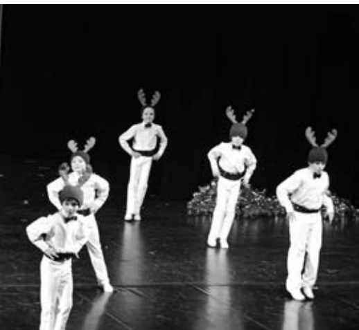
Oben: Die Rentiere sind unterwegs.