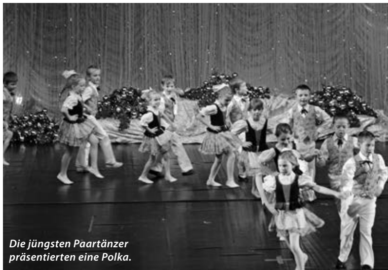
Die jüngsten Paartänzer präsentierten eine Polka.

In der Pause herrschte in der Garderobe und in den Gassen hinter der Bühne reges Treiben. Die erste Gruppe konnte den weiteren Verlauf der Probe kaum erwarten. Sie stand schon wieder startklar hinter dem Vorhang. Vielen kleinen Mäusen bin ich auf dem Weg in die Garderoben begegnet. Sie posierten schnell noch für die Presse und reichten im nächsten Moment die Hand der Betreuerin hin, damit diese den Handschuh darüberziehen konnte. Auch Rentiere und Schneemänner liefen mir über den Weg. Junge Damen in roten langen Kleidern waren schon wieder umgezogen,