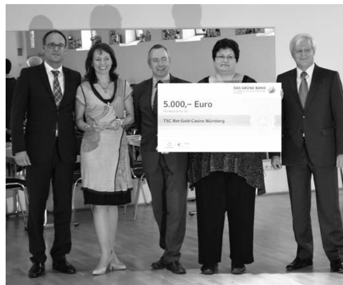
Mit 5000 Euro für die Jugendarbeit ist das „Grüne Band“ dotiert, das an den Vorstand des TSC Rot-Gold-Casino Nürnberg übergeben wurde.