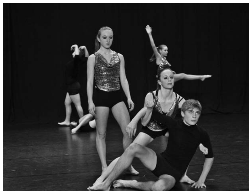
l'équipe, Small group Jugend.