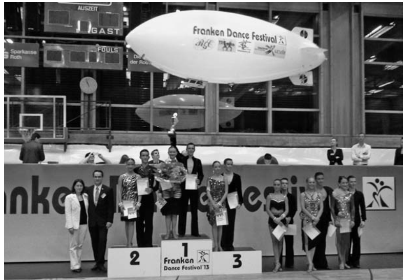
Per „Luftpost“ wurde der Trainingskostenzuschuss für die Sieger der Hauptgruppe A eingeflogen.

Am Abend des Samstags wurde zum zweiten Mal nach 2012 der Wolfram-Galke-Pokal ausgetanzt. Zur Erinnerung an den viel zu früh von uns gegangenen ehemaligen Sportwart des TSC Rot-Gold-Casino Nürnberg, Mitglied des TSZ Schwabach und Lehrwart des LTV Bayern wurde der Pokal in der Hauptgruppe A-Standard und