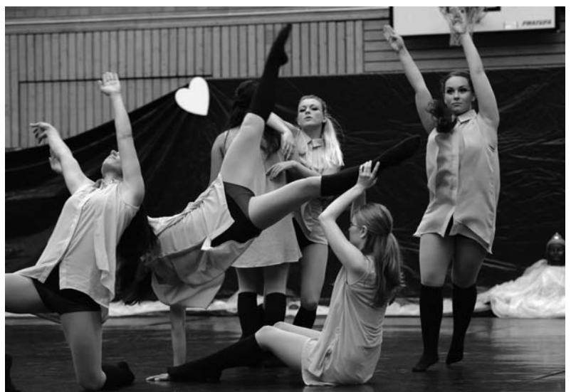
Sieg in der Hauptgruppe für die Gruppe Coppélia.