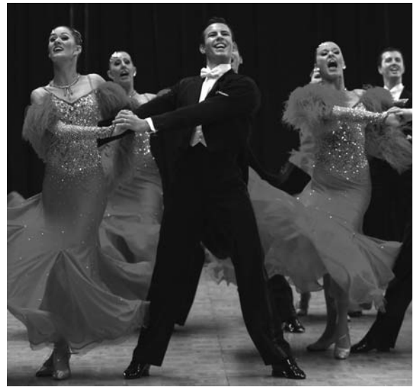
Gute Mannschaftsleistung vom 1. TC Ludwigsburg.