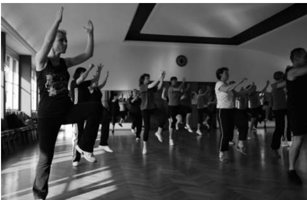
Zumba macht auch Männern Spaß.