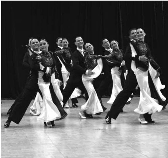
So sehen Sieger aus: der Braunschweiger TSC.