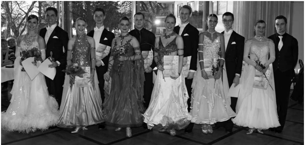
Siegerehrung in der B-Klasse.

Alle Ergebnisse unter www.tsz-blaugold.de