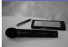
Handwerkszeug eines Turnierleiters.