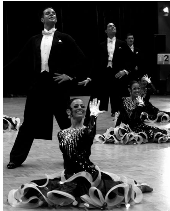
Das Erstliga-Standardteam des OTK Schwarz-Weiß Berlin muss sich keine Sorgen machen, was man vom Lateinteam in der Regionalliga nicht sagen kann.

ner – zur großen Freude der vielen mitgereisten Fans - auf den vierten Rang.