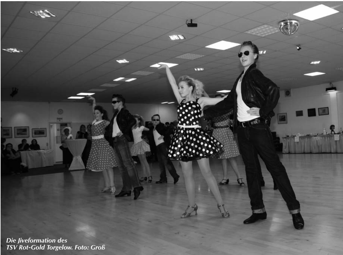
Die Jiveformation des TSV Rot-Gold Torgelow.

Cha und Polka ihren Spaß, der obendrein noch mit niedlichen „bambinogerechten“ Pokalen belohnt wurde.