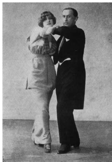
S. 12. Leonard, Journal des 1. Prix des 1. et 2. internationaux Champion Paris - Berlin, 1913 in Berlin

„100 Jahre Tanzsport in Deutschland“ soll kräftig gefeiert werden. Der DTV plant einen Gala-Ball mit einem attraktiven Programm quer durch den Tanzsport, an dem die Leistungsträger aus dem DTV und seinen Fachverbänden mitwirken werden. Ort ist das Maritim Hotel in Berlin, Stauffenbergstraße 26. Für den Gala-Ball wird es eine eigene Homepage geben; aktuelle Informationen dazu auf der DTV-Homepage www.tanzsport.de .