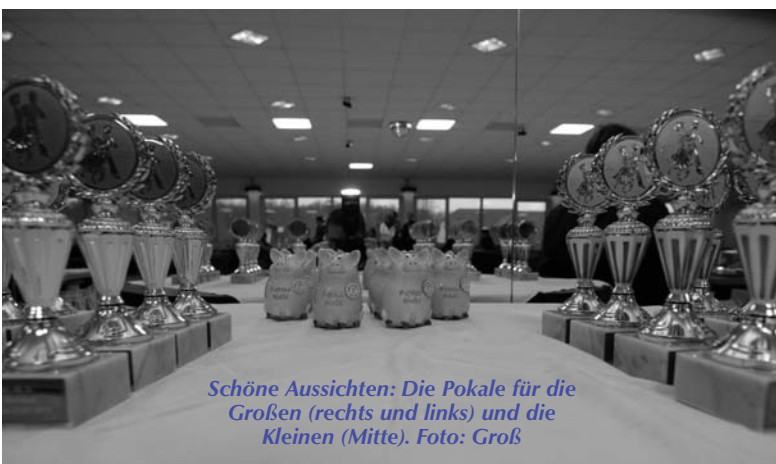
Schöne Aussichten: Die Pokale für die Großen (rechts und links) und die Kleinen (Mitte).