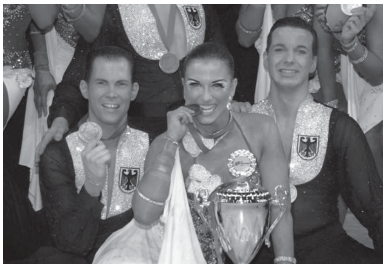
Foto oben: Tausende Zuschauer bei der Formations-Meisterschaft Foto unten: Zum Anbeißen – die bronzene WM-Medaille!

Hinter uns liegt ein unvergessliches Wochenende. Wir danken allen Beteiligten, die dieses