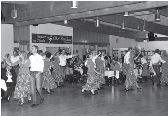
Schautanz der Breitensportgruppen zum Thema 90er Jahre

Vereinshauses gesteckt, in dem Platz genug geschaffen war, um in den eigenen vier Wänden Landesmeisterschaften und andere Wettkämpfe auszutragen. Mit den besseren Trainingsmöglichkeiten erhöhte sich auch die Mitgliederzahl auf jetzt fast 600. Auch die Turnierpaare profitierten von den neuen Gegebenheiten und ertanzten vielleicht auch deshalb etliche Meistertitel.