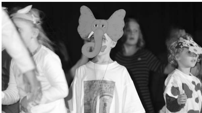
Mit phantasievollen Masken präsentierten sich die Kinder des TSC Werne.