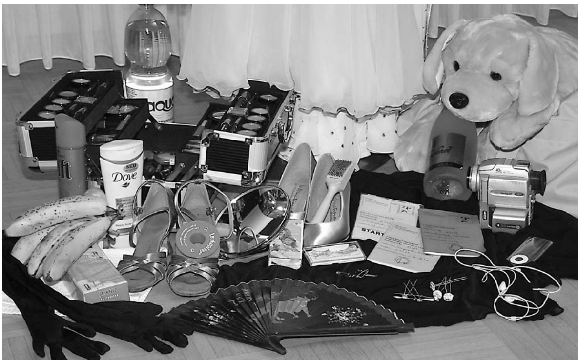
Das kleine Handgepäck der Turniertänzerin.