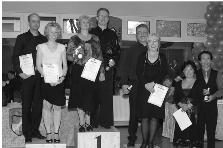
Siegerehrung BSW Senioren Latein.