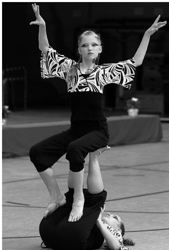
„Rhythm Nation“, Herner TC

Frohen Mutes und mit frischem Schwung begrüßte Barbara Hartmann am Sonntag die Formationen zur den beiden noch ausstehenden Qualifikationsturnieren. Beginnen sollten am Sonntag die jüngeren Tänzerinnen des TNW; sie wollten die offenen Plätze in der Jugendverbandsliga besetzen. Auf Grund von Änderungen im Regelwerk zur Altersstruktur für die Saison 2009 waren auch die Tabellenvierten der Jugendlandesligen zu der Qualifikation eingeladen. Auf diese Weise sollte