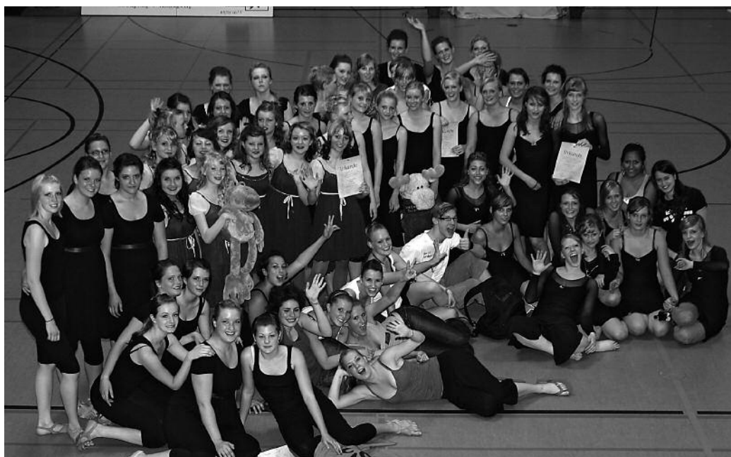
Neu für die Saison 2009 in der Verbandsliga: Devotion, Decertare, Suspeso, Glissard, Black Jack und Mission Dance

belegte mit ihrer Darbietung zu Musik aus dem Film „Lautlos“ Platz vier. Glissard erzählt die Geschichte von einem Mädchen, das davon träumt, eine Diva zu sein und auf einem roten Teppich im Blitzlichtgewitter zu stehen. In Schermbek stand die Formation zwar nicht