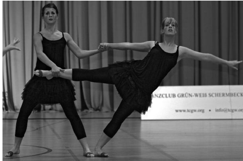
„Decertare“, DJK Gütersloh

Die Sieger des Tages hießen Devotion und kamen aus Brühl. Nach nur einem Jahr in der Landesliga sicherten sie sich einen Platz in