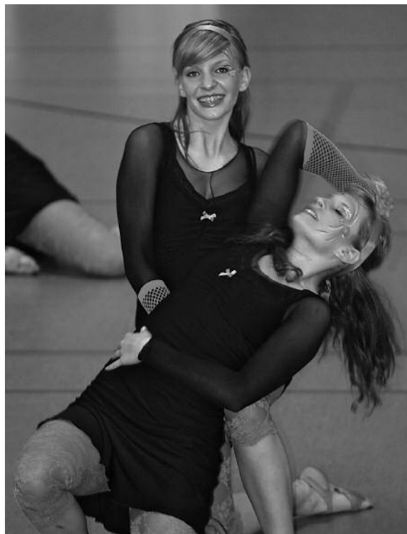
„Devotion“, TSC Brühl

Auch Glissard aus Dinslaken hat sich seinen Wunsch vom Aufstieg erfüllt. Die Mannschaft