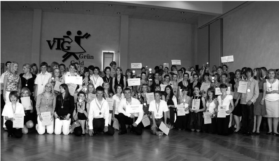
Sieger und Platzierte des zweiten Landeswettbewerbes „Tanzende Schulen“

Mit knappem Abstand folgten Team I und II der Realschule im Vestert Ahaus.