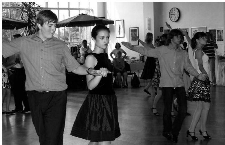
Die Latein- und Standardtänze waren genauso beliebt wie Hip-Hop