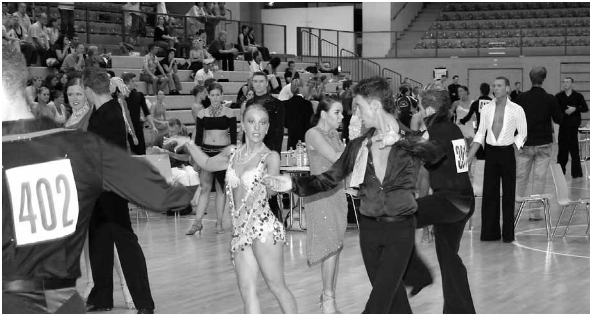
Gute Laune herrschte auf dem Großturnier in Bonn-Hardtberg

In den Katakomben der Bonner Hardtberghalle herrscht reges Kommen und Gehen. Paare begrüßen sich herzlich. „Lange nicht gesehen, wie geht es Euch?“ Großturniere sind eine optimale Gelegenheit, Bekanntschaften aufzufrischen. Während die einen bereits mit nassen Haaren wieder in ihre Alltagskleidung steigen, legen die anderen ihr Turnieroutfit an. Man hört viel Lachen und spürt gute Laune. „Komm, wir gehen einen Kaffee trinken“.