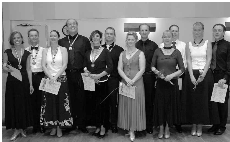
Finale der Senioren I D