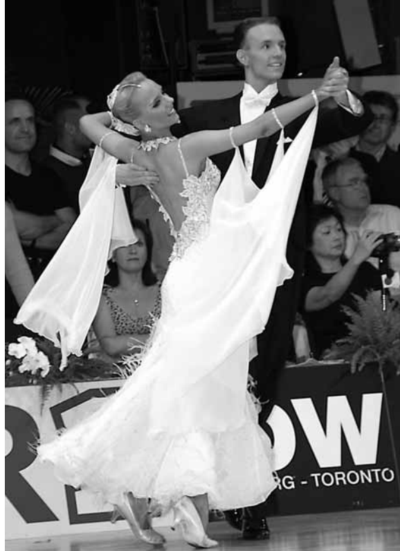
Oliver Rehder/Jasmin Rehder

Das GOC-Webteam nutzte wie in den beiden letzten Jahren den etablierten TNW-Chat für die virtuellen Gespräche mit Tanzsportlern. Oliver Wessel-Therhorn, Joachim Llambi, Christine Deck, Christian Polanc sowie Simo-