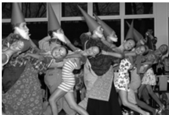
Die acht Zwerge und ihre Schneewittchen...

Die Ländermannschaften Standard der TNW-Jugend