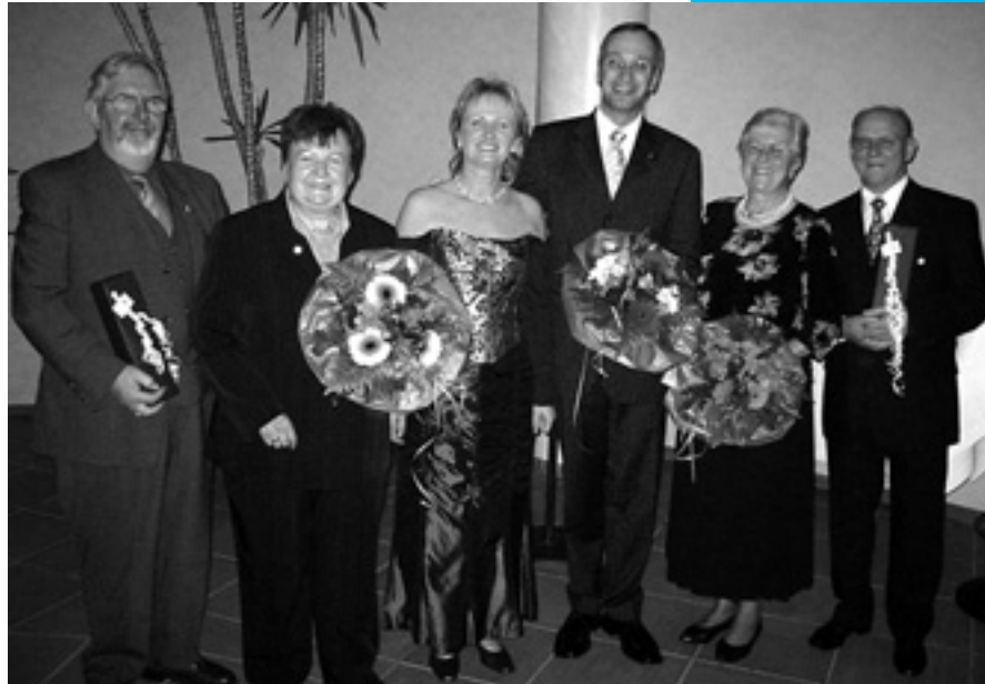
Ehrungen zum 40-jährigen Bestehen des TSC Blau-Weiß Paderborn

Nach einem erfolgreichen Tanzsportturnier im März dieses Jahres, das u.a. von vielen Ehrengästen aus der Politik und der Sportwelt der Stadt und des Kreises Paderborn besucht wurde, feierte der Tanzsportclub kürzlich sein diesjähriges