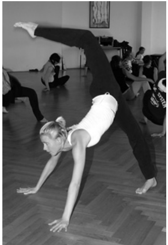
Der Bodengang verdeutlicht das Zusammenspiel von Technik, Konzentration und Körpergefühl

Die gelungene Mischung aus solider Technik und „Funky Style“ brachte den Saal zum Bro-