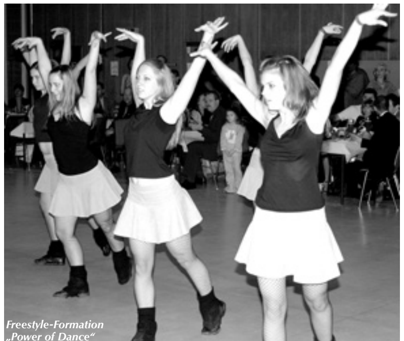
Freestyle-Formation „Power of Dance“