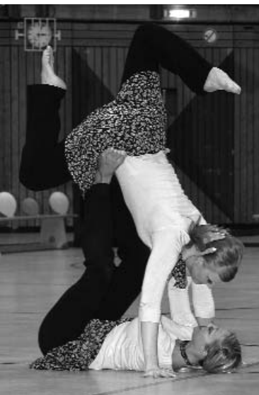
„poem dancers“ des ttc casino blau-gelb essen

Statistisch gesehen fiel eine Mannschaft bei dem Aufstiegsturnier zur Oberliga wohl gänzlich aus dem Rahmen: Es ist schon äußerst beachtlich, dass eine Mannschaft mit insgesamt 30 (und somit allen möglichen) Einsen den Aufstieg in die Oberliga feiert. Dass man aber einzelnen Mitgliedern aus dieser Formation zum 50., 60., 66. und sogar zum 80. getanzten Turnier in ihrem Startbuch gratulieren darf, das ist in der Landesliga wohl einzigartig. So geschehen beim "Nachwuchsteam" des Graf-schafter TSC Moers, seinem C-Team. Diese Mannschaft besteht zum größten Teil aus ehemaligen Bundesligatänzern, die mit dem aktiven Leistungssport schon aufgehört hatten. Die Freude am Tanzen ließ sie jedoch nicht los und sie bemerkten, dass sie den Spaß an den Turnieren wieder erleben wollten.