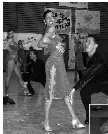
Umso mehr freuten sich die Tänzerinnen und Tänzer über den dritten Platz und somit den Auf-