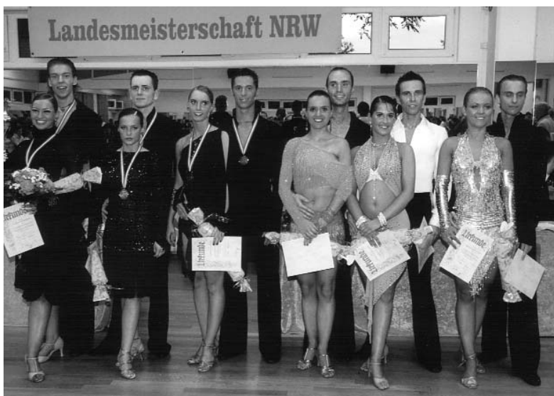
Siegerehrung der Landesmeisterschaft B-Latein

Wie immer bot das Clubhaus des TTC Rot-Gold Köln mit einem voll besetzten Haus und 33 startenden Paaren (zwei mehr als im Vorjahr) die besten Voraussetzungen für eine Landesmeisterschaft.