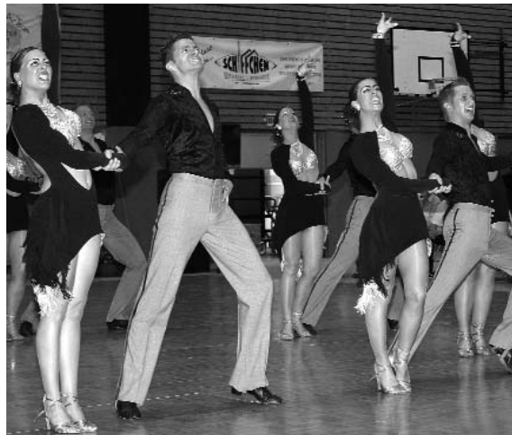
Das Saisonziel klar erreicht hat der 1. TSC Emsdetten

Für das C-Team des TTC Rot-Weiß-Silber Bochum war schon die Teilnahme an dem Aufstiegssturnier ein großer Erfolg, bildete sich diese Formation doch erst in dieser Saison aus einem Aufbauteam des Vereines neu und trat zum ersten Mal zu Turnieren an.