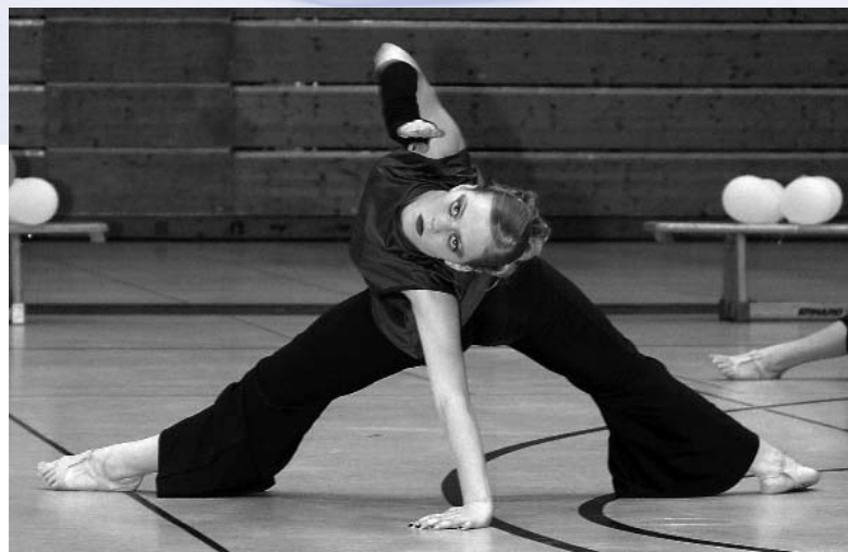
Flash Fire des TSC Holiday Werther auf Platz zwei

Aus Hilden kam der nächste Starter, die Formation "Expression", die mit starken Beats die Choreografie effektiv umsetzte. Die Tänzerinnen der Formation "Dance Relation" aus Ibbenbüren präsentierten ihren Tanz flächenfüllend und ausdrucksstark. "Metropolitans" aus Bielefeld tanzte zu klassischer Musik spannungsreich mit exklusiven Elementen den letzten Durchgang. Als vorletzte Formation betrat "Flash Fire" aus Werther die Fläche, die zu einem Musikmix aus den Matrixfilmen eine abwechslungsreiche