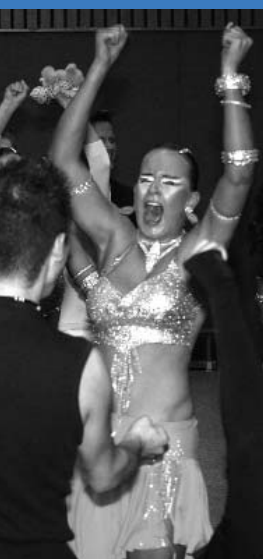
Aufstiegsjubiläum beim Gastgeber TSZ Bocholt 01, unten beim Durchgang