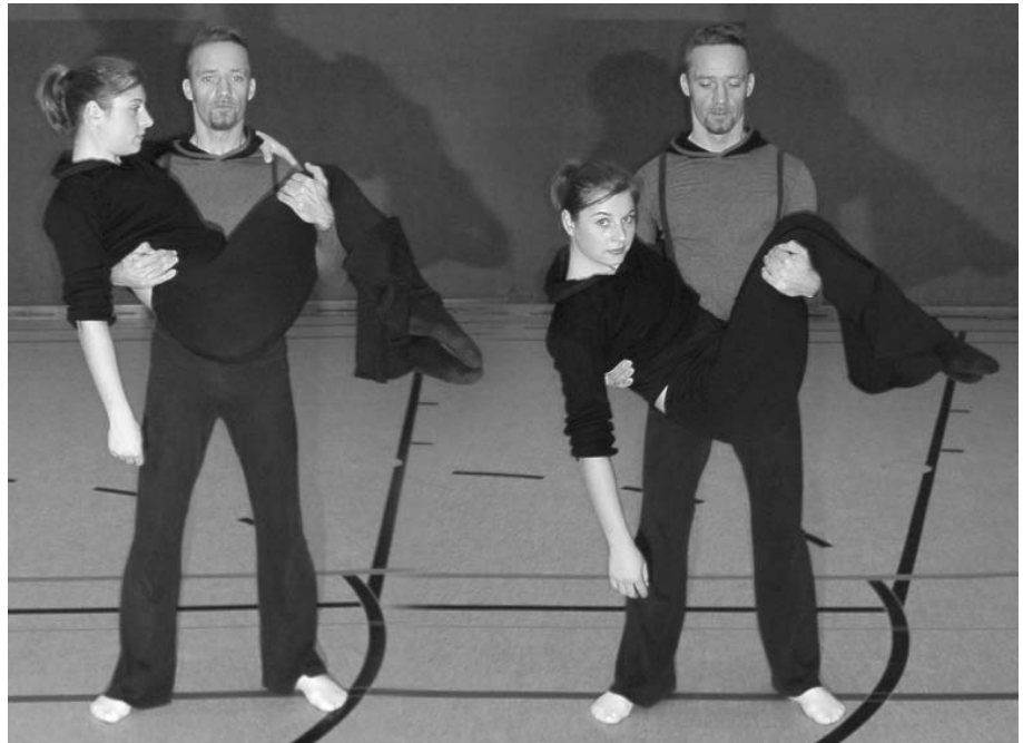
2.) Fällt die Entscheidung zwischen richtig und falsch leicht? Körperspannung ist gefragt und das Finden des korrekten Schwerpunktes für das Gleichgewicht.

Betrachten wir die Hebung aus einem anderen Blickwinkel: "Und Sprung!" lautet der Startschuss. Mit der Gewissheit, dass gleich etwas passiert, erscheinen die Sekunden wie