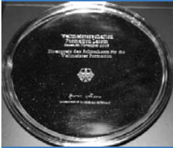
Bundeskanzler Gerhard Schröder stiftete als Schirmherr der Veranstalter diesen Ehrenteller, den die Siegermannschaft nach Litauen mitnahm.

Noch immer zeichnen sich meine Lieblingsthemen und Musiken dadurch aus, dass sie nicht "um die Welt" gegangen sind. Dazu zählen die legendären Themen "Chess" und "Magic". Während "Magic" ein Versprechen an eine ehemalige Kinderformation war: "Wenn ihr mal im B-Team seid...", hat "Chess" eine andere persönliche Note. Ein ehemaliger Tänzer der Formation studierte "Chess" mit dem Team aus Erkelenz ein. Ein adäquater Einmarsch musste gefunden werden. Die in Auftrag gegebene Recherche brachte die "Wiener Eröffnung" aus dem Jahre 1900 ans Licht – eine Mühe, die sich gelohnt hat.