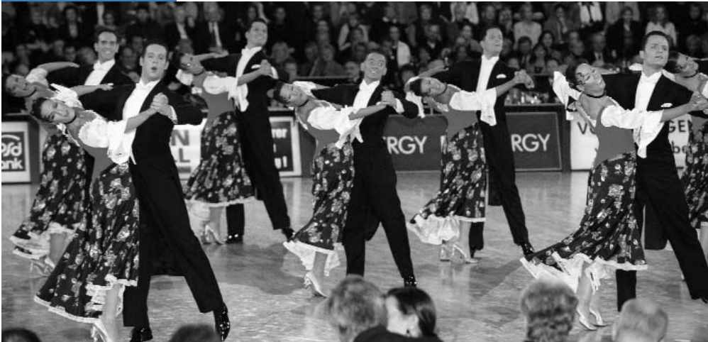
Die Standardformation des TD TSC Düsseldorf Rot-Weiß sorgte für geteilte Meinungen im Publikum.