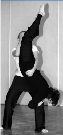
Hebung für Fortgeschrittene! Nicht zur Nachahmung von Ungeübten empfohlen.

sen. Unter Hebungen versteht die Turnier- und Sportordnung (TSO) im Grundsatz Figuren, bei der eine Person mit Hilfe einer zweiten vom Boden abgehoben wird.