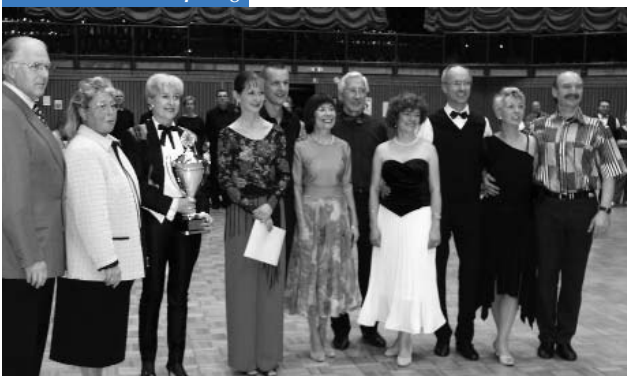
Siegerehrung beim BSW-Pokal