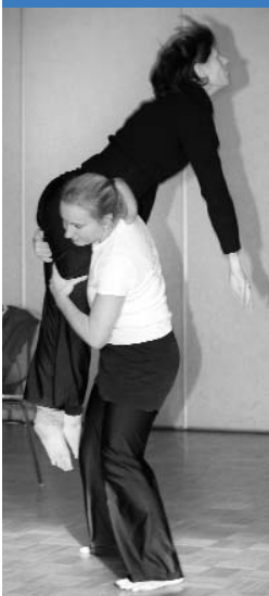
Hebefigur, die physiologischen Background erfordert.

So schreibt Hollmann, dass "unterhalb von ca. 10 Jahren kaum eine Trainierbarkeit im Sinne der morphologischen Adaptation (biologisch/körperliche Anpassung) im Bereich Kraft stattfindet." 2 Was nichts anderes bedeutet, als: Der durch Muskelaufbautraining gewünschte Erfolg wird sich bei Kindern nicht einstellen. Muskelaufbau erfolgt im Grundsatz das Ziel der Körperstabilisierung. Dieses Ziel wird erreicht, wenn das Knochenwachstum abgeschlossen ist. Da Kinder sich jedoch noch im Wachstum befinden,