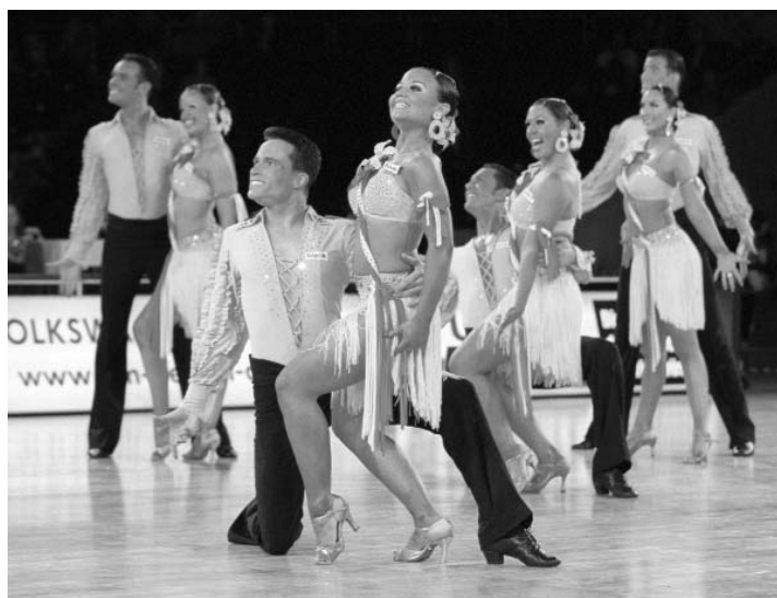
Als Sieger der vergangenen Bundesliga bereits zur WM qualifiziert musste sich das TSZ Aachen auf der Deutschen Meisterschaft zunächst mit Platz drei zufrieden geben. In Essen drehten sie das Ergebnis um.

Eigenwillig und ein wenig gewöhnungsbedürftig erschien dagegen der 1. TC Ludwigsburg mit "Tanz der Galaxien". Musiken aus Science-fiction Filmen und das eigenwillige Outfit der Damen gaben Anlass zu vielen Diskussionen. Dennoch gelang es der neu gegründeten Formationsgemeinschaft Olympia TK/Schwarz-Weiß Berlin (ehemals Post SV Berlin) und dem TD TSC Düsseldorf Rot-Weiß nicht, an die Leistung der Ludwigsburger heranzukommen. Ludwigsburg wurde Vizemeister und sicherte sich damit neben Braunschweig das zweite Ticket für die Anfang Dezember in Stuttgart stattfindende Weltmeisterschaft.