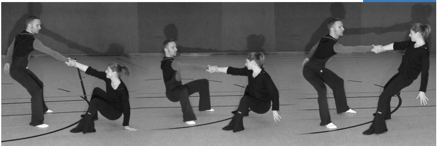
3.) Sind Sie sich sicher? Wichtig ist die korrekte Kraftverteilung, um (nicht nur) die Gelenke beider Partner zu schonen.

Ein letzter Blick in die Sporthalle: Die Kinder und Jugendlichen tanzen nicht, sondern führen eine angeregte Diskussion mit ihrer Trainerin. "Warum machen wir keine Hebungen? Die sehen immer so toll aus! Hebungen sind etwas Besonderes!", lautet die Meinung