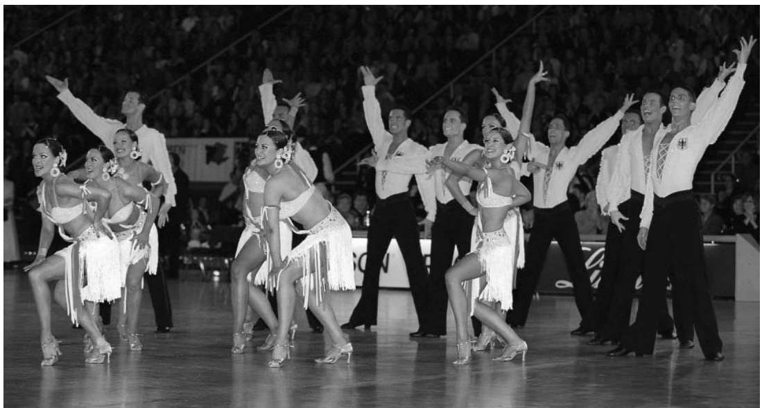
TSZ Aachen mit dem Schlussbild von "Latin America"