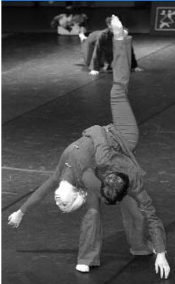
„Meisterleistung“ TSC Blau-Gold Saarlouis mit „autres choses“

der Kinder. An dieser Stelle muss sich jeder Trainer seiner Verantwortung und den damit verbundenen Risiken bewusst sein. Arbeitet er Hebfiguren ein, setzt er die Kinder auf ein Pulverfass, ohne zu wissen, ob es hoch geht.