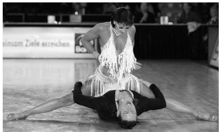
Trotz vollem Einsatz erreichte das Düsseldorfer Favoritenteam nur Platz vier.

Jazzig präsentierte sich das Düsseldorfer Latein-Team. Eindeutig mit der Handschrift