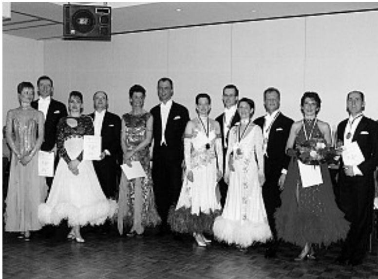
Endrunde der Senioren I A von rechts nach links.