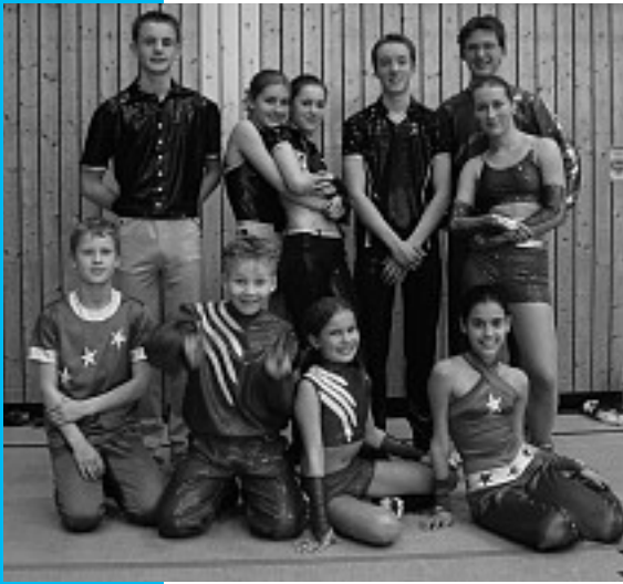
Erfolgreicher Start in die Saison bei den Flying Saucers.