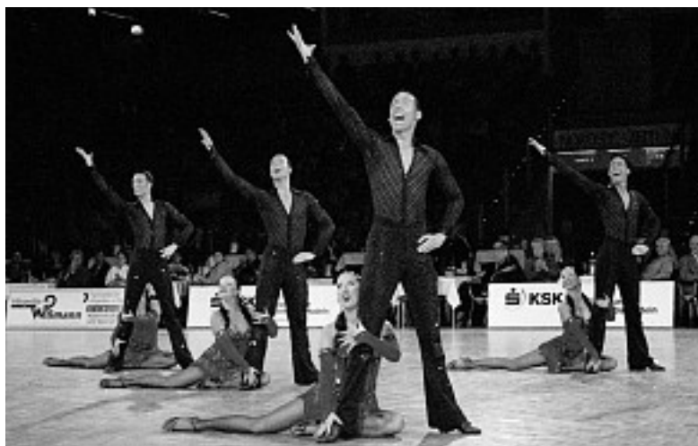
Zweiter Platz für die TSG Bremerhaven in Bremerhaven.

Am zweiten Tag richtete der TTC Gold und Silber die Turniere der Oberliga und Regionalliga Nord Latein aus. Auch die jeweils acht Teams dieser beiden Ligen gingen vor ausverkauftem Haus, das heißt gut eintausend Zuschauern, an den Start. Für die Oberliga war es das mit Spannung erwartete erste Turnier der Saison. Bereits in der Vorrunde meldeten die Teams vom TSZ Blau-Gelb Bremen und vom TSC Hansa Syke, beide Aufsteiger aus der Landesliga, durch ihre guten Vorträge ihren Anspruch auf den Siebertitel