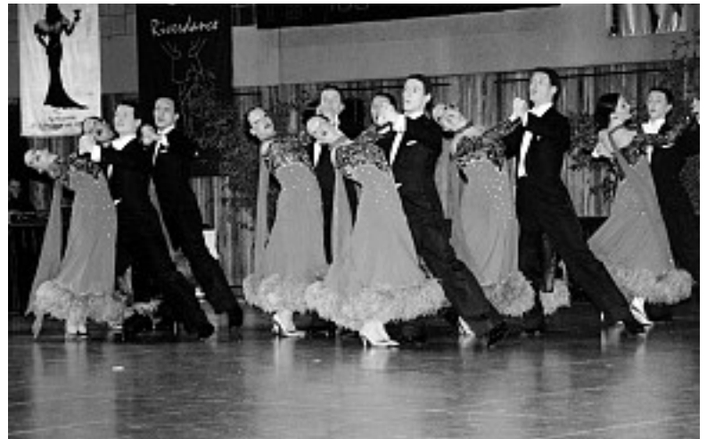
Das Braunschweiger B-Team nimmt die Spitzenposition in der zweiten Liga ein.

Das Auftaktturnier der Regionalliga Nordwest Standard eröffnete die Veranstaltung. Neben Bekanntem (bei den Choreographien hatten fast alle Mannschaften auf Altbewährtes zurückgegriffen) gab es auch Neues zu sehen: Beim TSZ Blau-Gelb Bremen tanzten alle Tänzerinnen und Tänzer am Samstag ihr erstes Formationsturnier überhaupt - und verkauften sich gut. Der Zweitligaabsteiger Saltatio Hamburg trat sehr dynamisch auf und war mit dem erreichten vierten Platz nicht zufrieden. Die Mannschaft des TSZ Bad Oeynhausen der letzten Saison war als Grün-Gold TTC Herford am Start und plazierte sich - auch für sie selbst unerwartet - auf dem Bronzerang. Der TCH Oldenburg stellte mit dem 2. Platz nach 2002 zum zweiten Mal die Weichen in Richtung Relegationsturnier. Das TSZ Wetter-Ruhr hatte unter diesem Namen und in dieser Zusammensetzung Premiere, einige der Tänzer hatten allerdings bei Essen und Düsseldorf bereits Formationserfahrung gesammelt. Die motivierte Mannschaft erntete den Sieg - allerdings nicht unangefochten. Die weite Streuung der Wertungen im großen Finale zeigte, dass für den Verlauf der Liga noch alles offen ist, zumal bis zum nächsten Aufeinandertreffen der Mannschaften sechs Wochen Zeit sind.