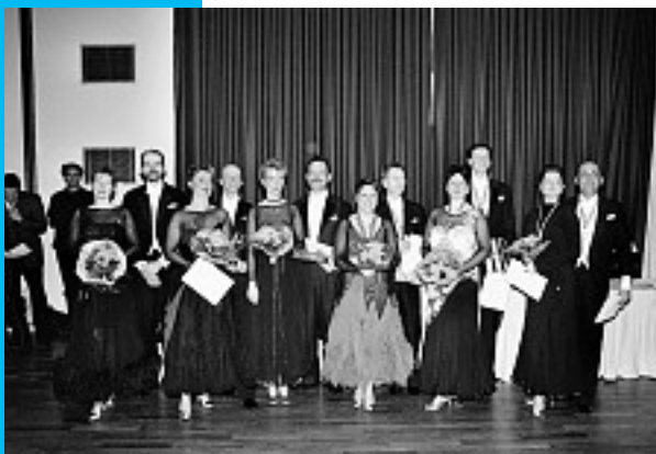
Die Senioren I A von rechts nach links.