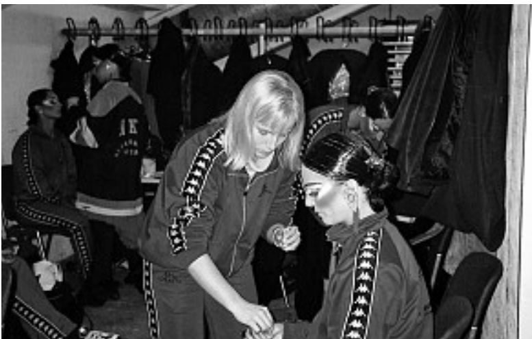
Platz ist in der kleinsten Hütte - wenn es denn sein muß.