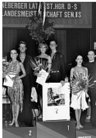
Das Treppchen für die S-Klasse.