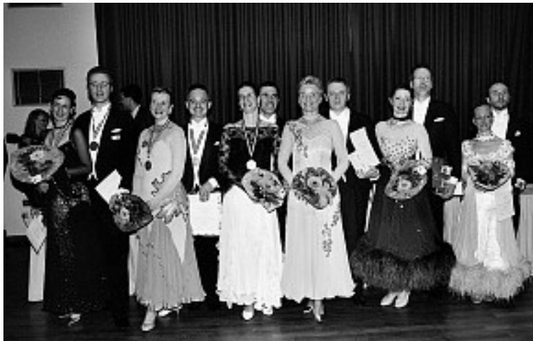
Endrunde der Senioren I B von rechts.

Alle Ergebnisse der TSH-Landesmeisterschaften auf den Internetseiten des TSH unter www.tanzen-in-sh.de .