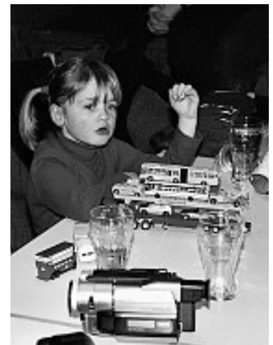
Offensichtlich ist das Geschehen auf dem Parkett doch interessanter als der beachtliche Fuhrpark auf dem Tisch.