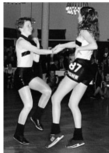
Rock'n'Roll war erstmals dabei.